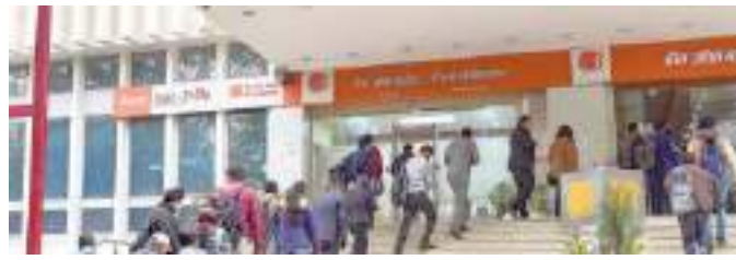
Gross domestic advances grew by about 5 per cent yoy to ₹3,82,365 crore as at December-end 2021

(NPAs) position improved to 10.46 per cent of gross advances in the reporting quarter against 12 per cent in the preceding quarter. The Net NPA (NNPA) position also improved to 2.66 per cent of net advances against 2.79 per cent.