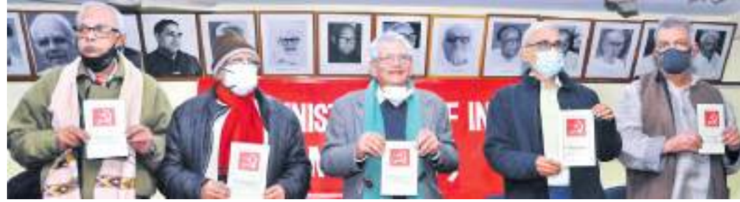
மத்தியில் ஆளும் பாஜக ஆட்சியை அகற்றி, மதச்சார்பற்ற ஜனநாயகத்தைப் பாதுகாக்க மார்க்சிஸ்ட் கம்யூனிஸ்ட் கட்சி சமீபில், தில்லியில் வெள்ளிக்கிழமை வரைவு அரசியல் தீர்மானத்தை வெளியிட்ட அந்தக் கட்சியின் தேசிய பொதுச் செயலாளர் சீதாராம் யெசுசூரி, பொலிட்பிரோ உறுப்பினர்கள் தபன் சென், ஹன்னன் மொல்லா, பி.என். ராகவனு உள்ளிட்டோர்.